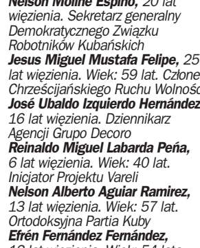
Nelson Moline Espino , 20 lat więzienia. Sekretarz generalny Demokratycznego Związku Robotników Kubańskich